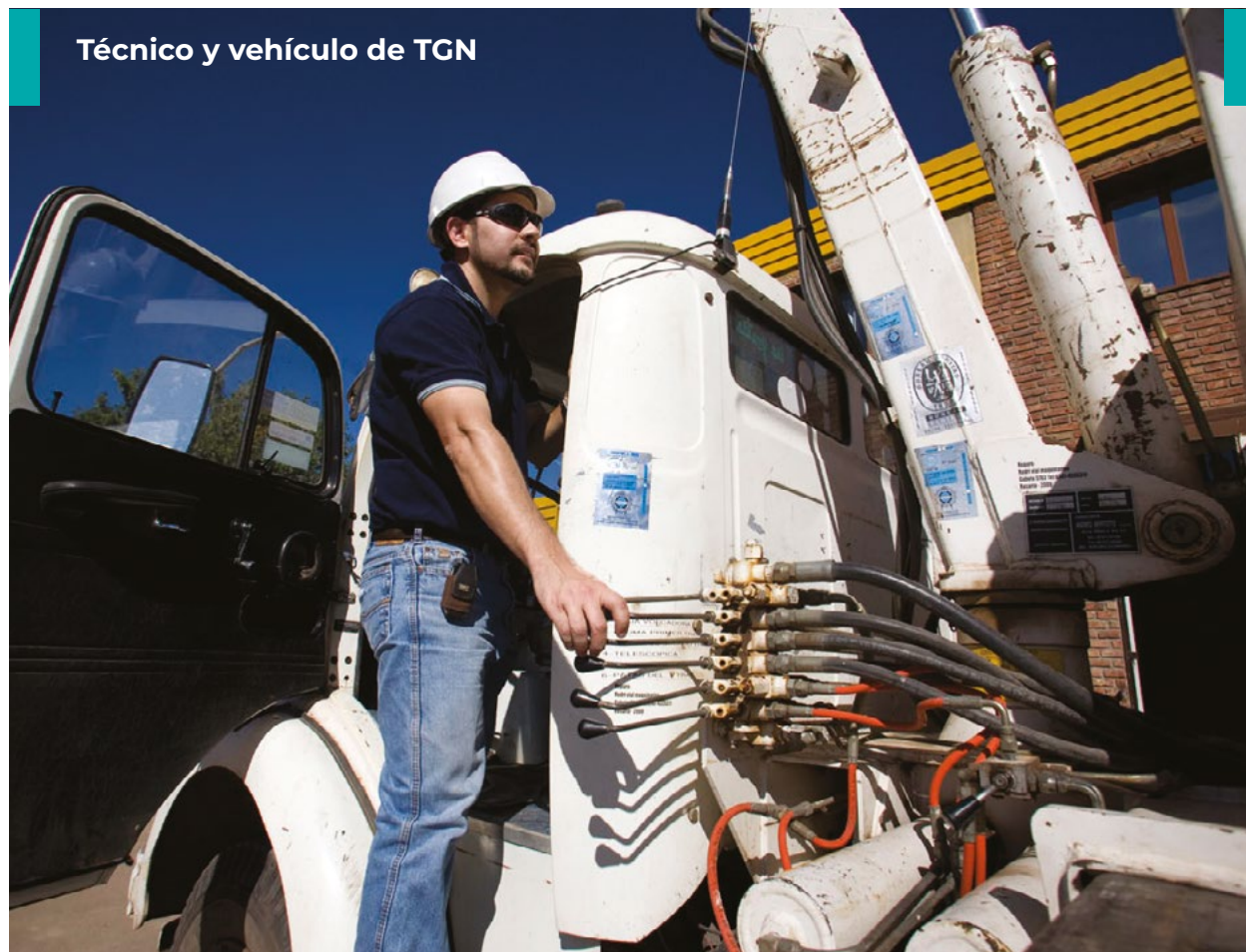
Técnico y vehículo de TGN

Si se detectase la presencia de alguna de estas situaciones mencionadas, el personal especializado de TGN debe ser avisado de inmediato para que concurra al lugar a investigar lo que ocurre.