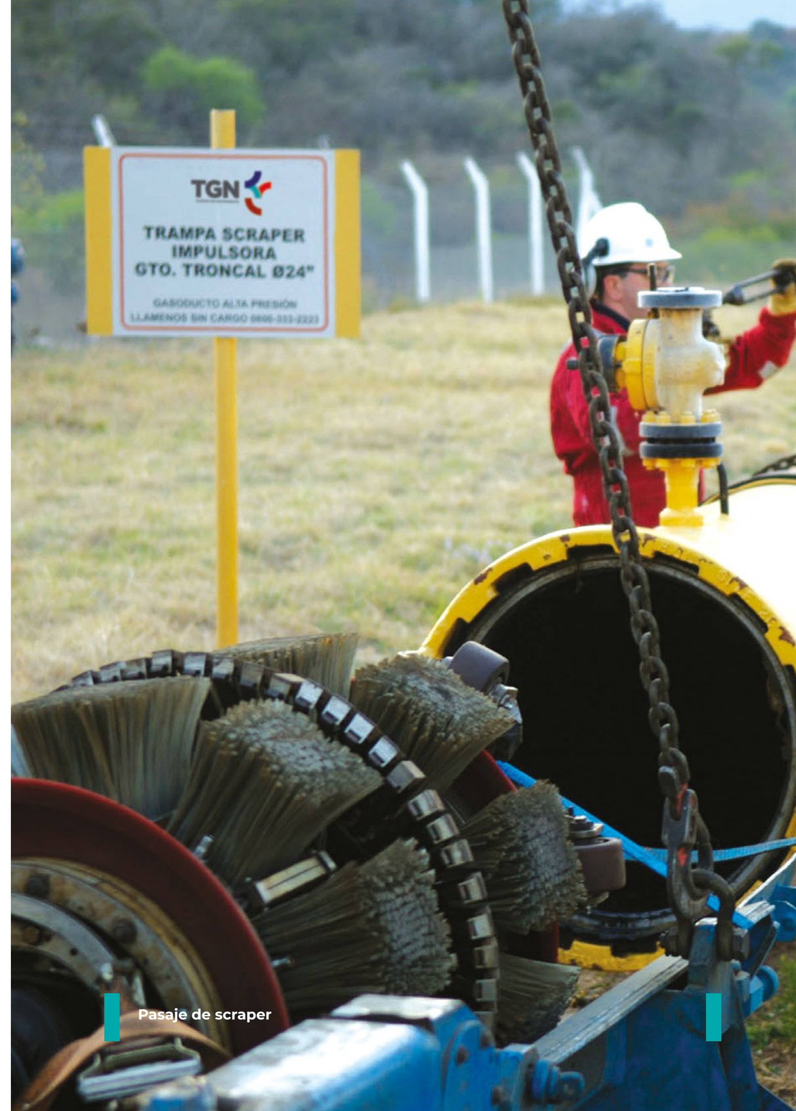
Pasaje de scraper