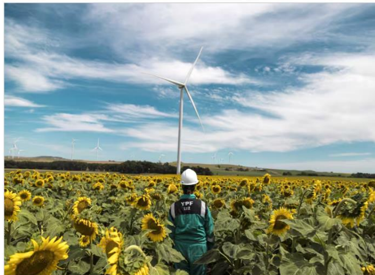
En YPF Luz mejoraron los procesos de programación y ejecución de órdenes de mantenimiento, y la gestión de pérdidas de generación.

El segundo caso corresponde a YPF Luz, la compañía que hoy produce cerca del 10% de la energía eléctrica que consumen los argentinos y, además, es un socio estratégico de Toyota Argentina, puesto que provee electricidad de fuentes renovables para abastecer en un 100% la demanda de la planta de Zárate donde se producen Hilux y SW4 para comercializar dentro del país y exportar en la región.