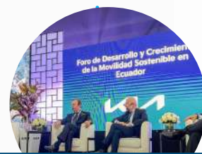
Conferencias y foros con speakers nacionales e internacionales