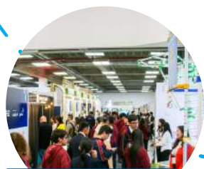
Zona Expo de emprendimientos sostenibles