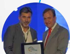
Reconocimiento: Empresas más Sostenibles del Ecuador, con metodología Triple Impacto y ONG'S destacadas