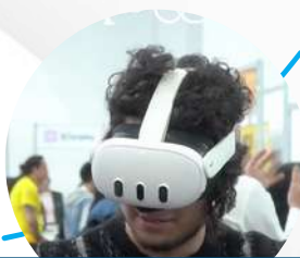
Actividades sensoriales e interactivas relacionadas a la sostenibilidad