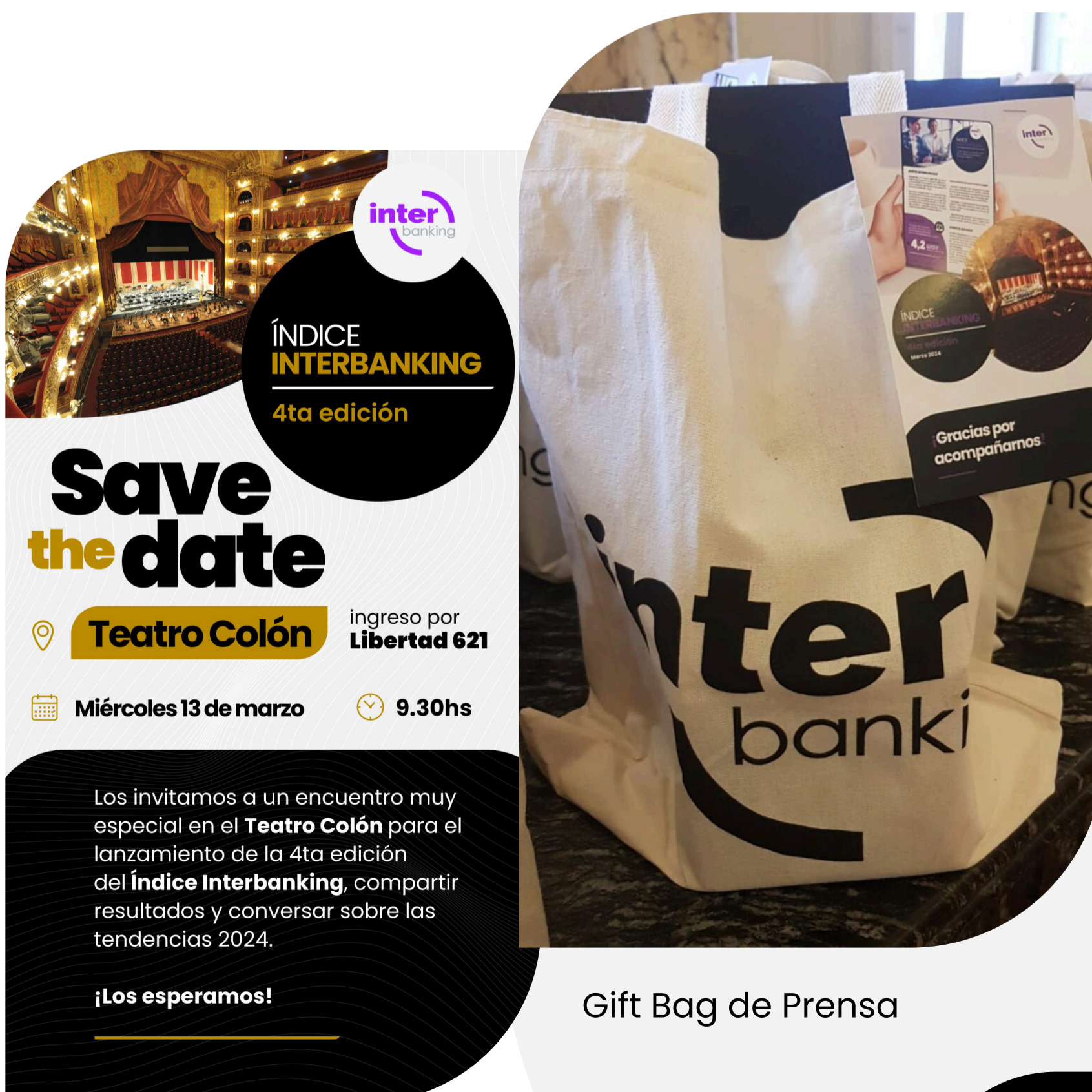
Gift Bag de Prensa

Durante el encuentro, se realizó la presentación del Índice Interbanking , mostrando los principales resultados, y se conversó sobre las tendencias de la industria financiera, con espacio para preguntas. Finalizada la presentación y la entrega de press kits, se realizó una visita guiada por el Teatro Colón, donde se recorrieron los talleres de armado de escenografía y vestuario que hace posible la puesta en escena de las obras.