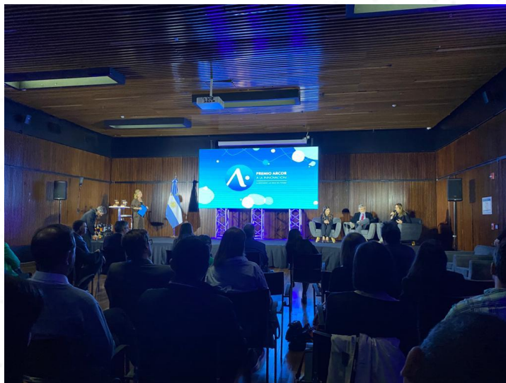
Imágenes del evento a auditorio repleto