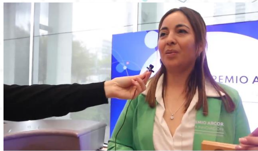
¡Conocé el proyecto ganador de la Mención Especial de Fundación Arcor...