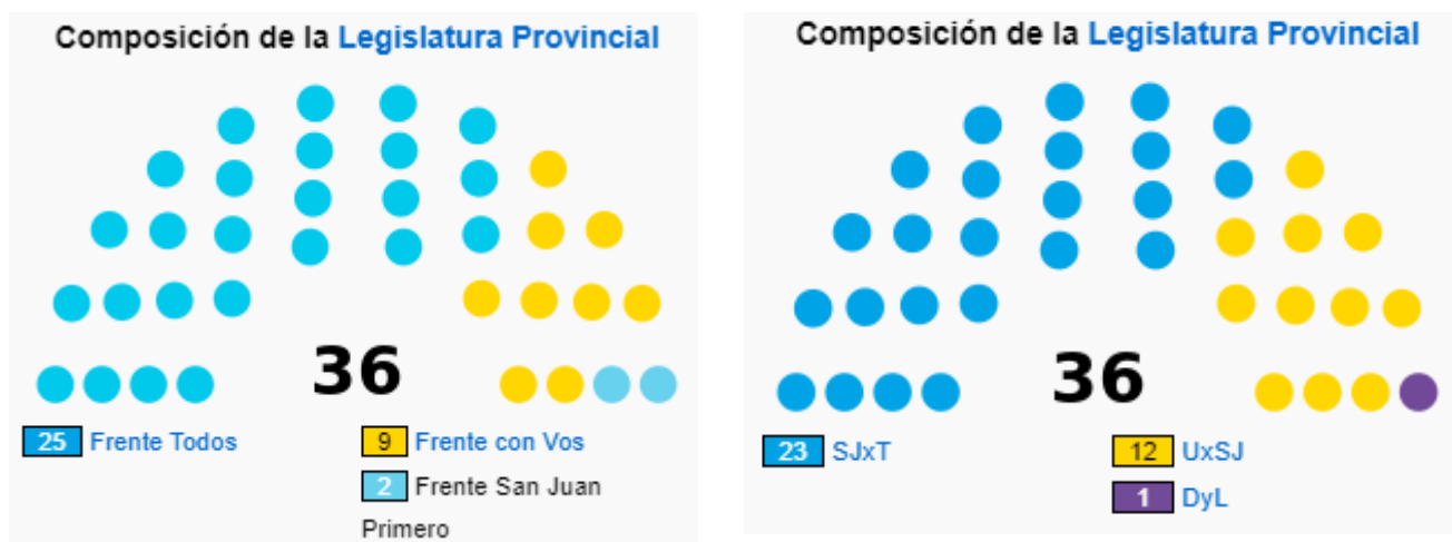
Composición de la legislatura 2019 vs. 2023

Previo a la elección para gobernador, el 14 de mayo se votó para intendentes y los cargos legislativos provinciales. El peronismo de Uñac y Gioja obtuvo 9 de los 17 diputados proporcionales en juego, mientras que Orrego obtuvo 7. Aquellos diputados que se eligen por la elección departamental, el oficialismo obtuvo 14 de 19, mientras que Orrego logró 5. En resumen, la composición de la Cámara de Diputados quedó en 23 diputados para el peronismo (tenía 25), 12 para para la fuerza de Orrego (tenía 9) y 1 para Desarrollo y Libertad.