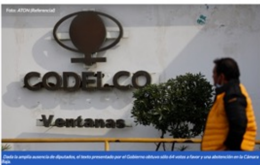
Debido a la amplia asistencia de diputados, el texto presentado por el Gobierno obtuvo solo 64 votos a favor y una abstención en la Cámara Baja.