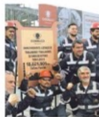
Los trabajadores de Ventanas también estuvieron presentes.