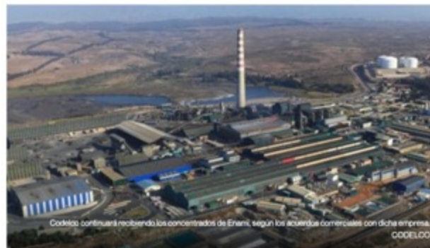
Codelco continuará recibiendo los concentrados de Enami, según los acuerdos comerciales con dicha empresa. CODELCO