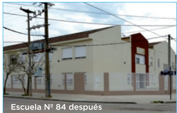
Escuela N° 84 después