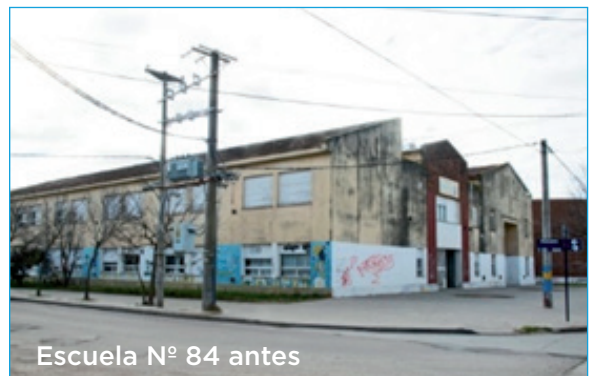
Escuela N° 84 antes